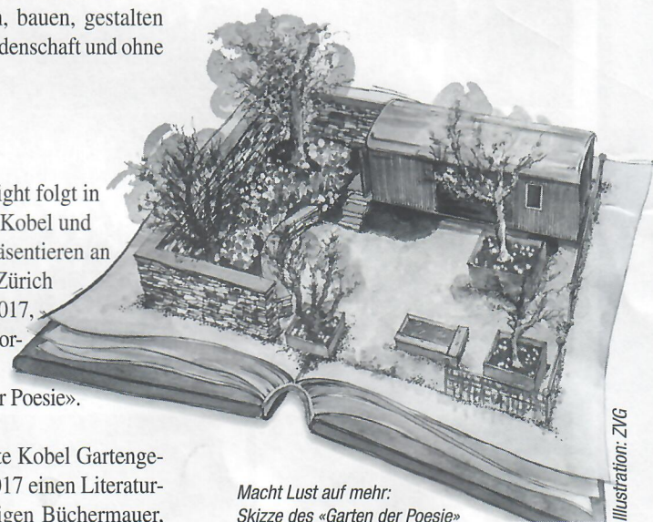
Macht Lust auf mehr: Skizze des «Garten der Poesie»